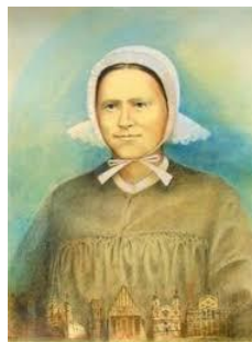
BL. MARIA LUIZA Merkert, dziewica